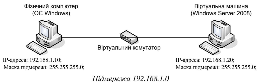
Рис. 1 – Конфігурація віртуальної мережі

Отже, отримана наступна конфігурація комп'ютерної мережі: