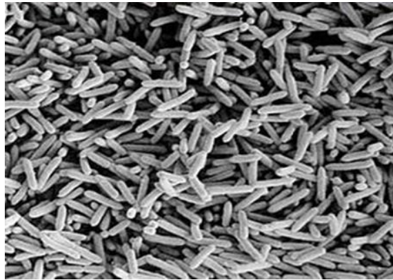
Рисунок 1.1 – Acetobacter aceti

Для процесу одержання оцтової кислоти з етилового спирту, у всіх методах використовуються оцтові бактерії виду Acetobacter aceti (рис. 1.1).